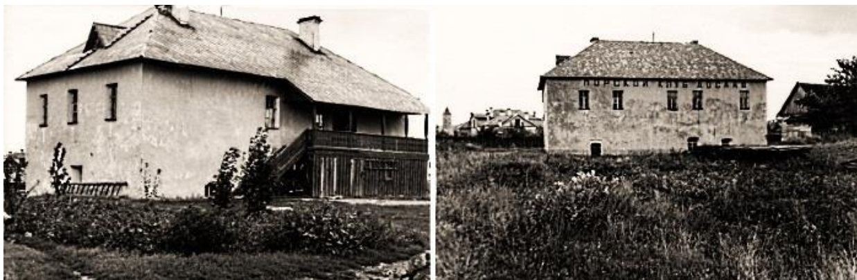
Дом Воинова. Палаты XVII века